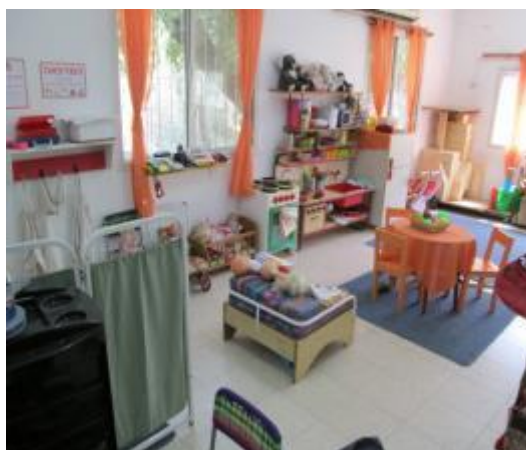
תמונה 3 : חתר הפעילות