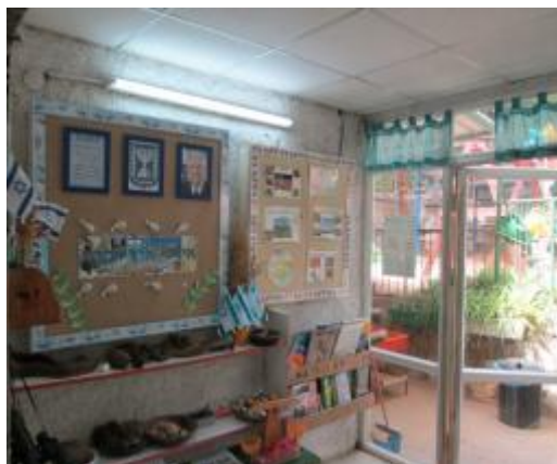
תמונה 2 : אולם הגן